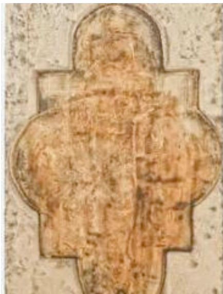
Imatge de l'exposició 'Mirades en escac' (Centre de Lectura)

CENTRE DE LECTURA C. Major, 15 43201 REUS