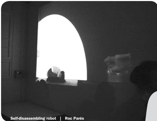
Self-disassembling robot | Roc Parés

A Metrònom, seu de la Fundació Rafael Tous d'Art Contemporani, es van inaugurar el passat 18 de febrer dues exposicions: a la Sala Central, “8 cosas (re-presentaciones, de-construcciones y visiones indirectas)” de Francisco Ruiz de Infante, i, a la sala Àfrica, “Self-disassembling robot” de Roc Parés. Sens dubte els artistes i el públic en general que sovintejava la Sala Reus de l'Àrea d'Art i Creació de l'IMAC, recordarà encara la instal·lació que Ruiz de Infante va realitzar “in situ” per a aquest espai. Així mateix, recordarà també l'artista Roc Parés, que vam poder veure a Reus en dues ocasions: una a la Sala Fortuny de la nostra entitat amb l'exposició “Roc Parés” l'any 1996, i l'altra en l'exposició col·lectiva “Tech-driven society”, realitzada a la Sala Reus dins la programació de l'any 1999, ambdues comissariades per qui signa aquest article.